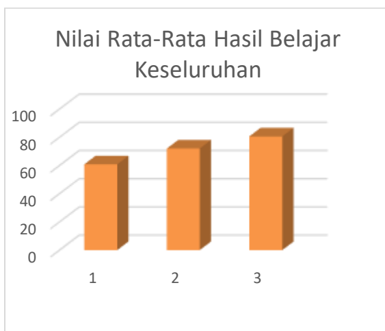
Grafik 1. Rincian Nilai Rata-rata Hasil Belajar Keseluruhan

tahap pra siklus, siklus I dan siklus II dapat dilihat bahwa nilai hasil belajar peserta didik mengalami peningkatan disetiap tahapannya. Untuk memudahkan dalam pembacaan data maka disajikan grafik terkait nilai rata-rata hasil belajar dari tahap pra siklus, siklus I dan siklus II, sebagai berikut :