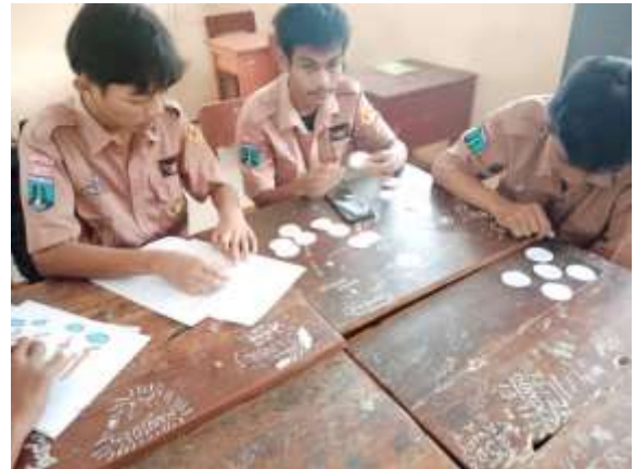
Gambar 2. Diskusi kelompok

Setelah pembelajaran selesai, guru membagikan lembar tes kepada peserta didik untuk mengukur hasil belajar dan ketercapaian pembelajaran yang telah dilaksanakan pada hari itu. Setelah dilakukan tabulasi dan analisis data diperoleh nilai hasil belajar pada siklus I adalah sebagai berikut :