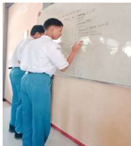
Gambar 4. Pelaksanaan tindakan siklus II

hak atau kewajiban. Setiap kelompok akan menulis kembali isi dari kartu hak dan kewajiban di depan papan tulis sesuai dengan kolom hak atau kewajiban. Kelompok yang mampu menyelesaikan lebih dahulu dan mendapat poin terbanyak akan mendapatkan penghargaan ( reward ).